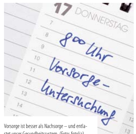
Vorsorge ist besser als Nachsorge – und entlastet unser Gesundheitssystem.